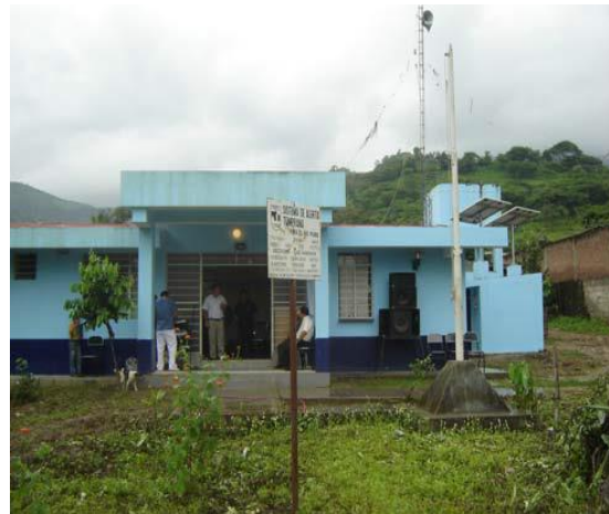
Fotos: Sistemas fotovoltaicos para iluminación, refrigeración y radio comunicación en los puestos de salud de Ternique y Los Ranchos