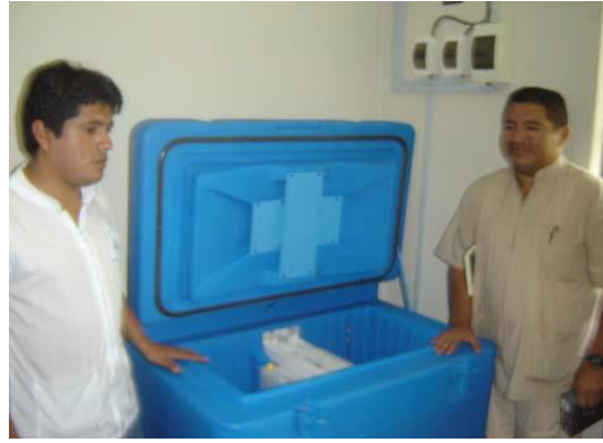
Fotos: Sistemas fotovoltaicos para iluminación, refrigeración y radio comunicación en los 09 puestos de salud